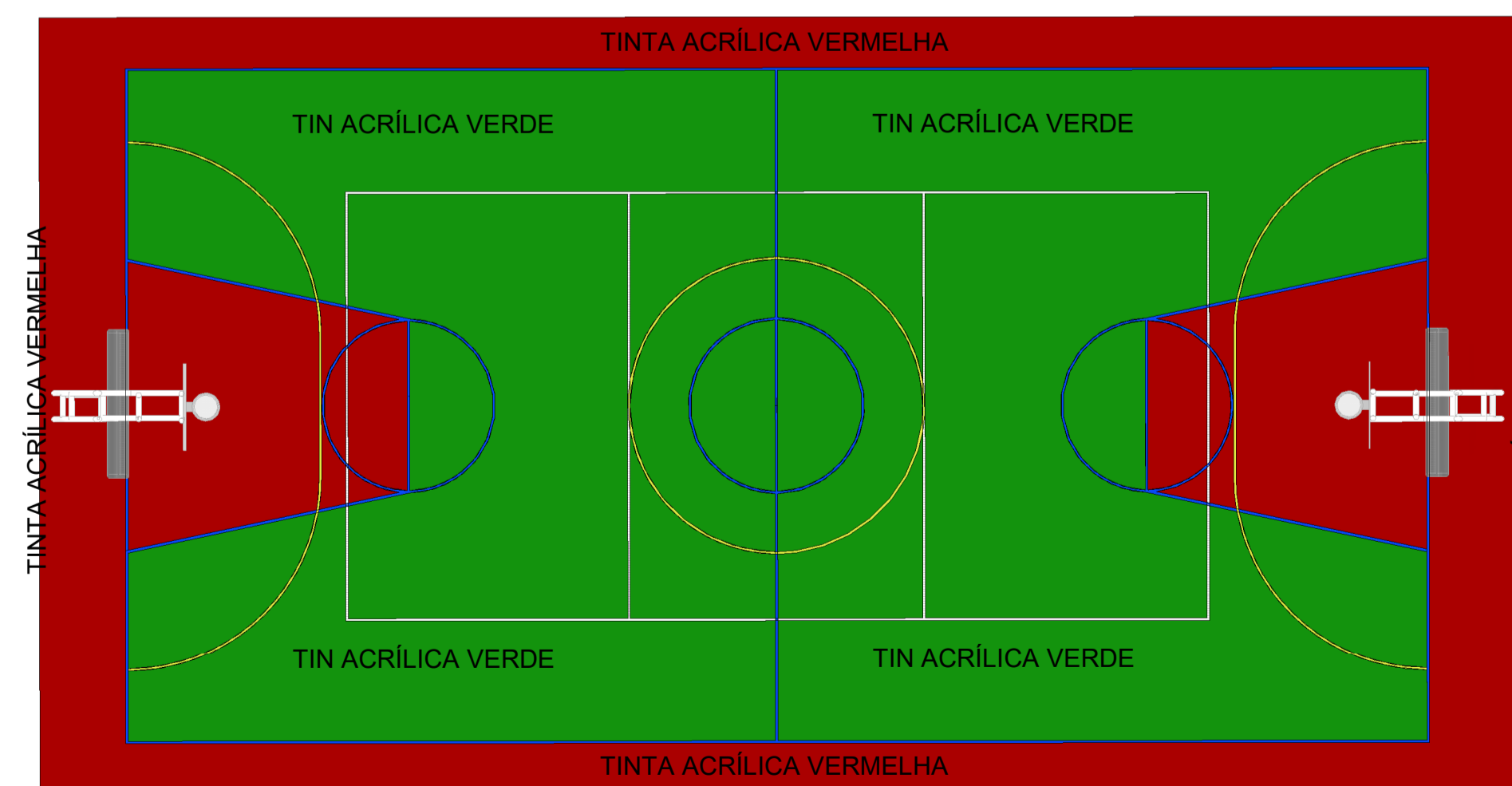
2 Detalhamento pintura de piso ESCALA - 1 : 125